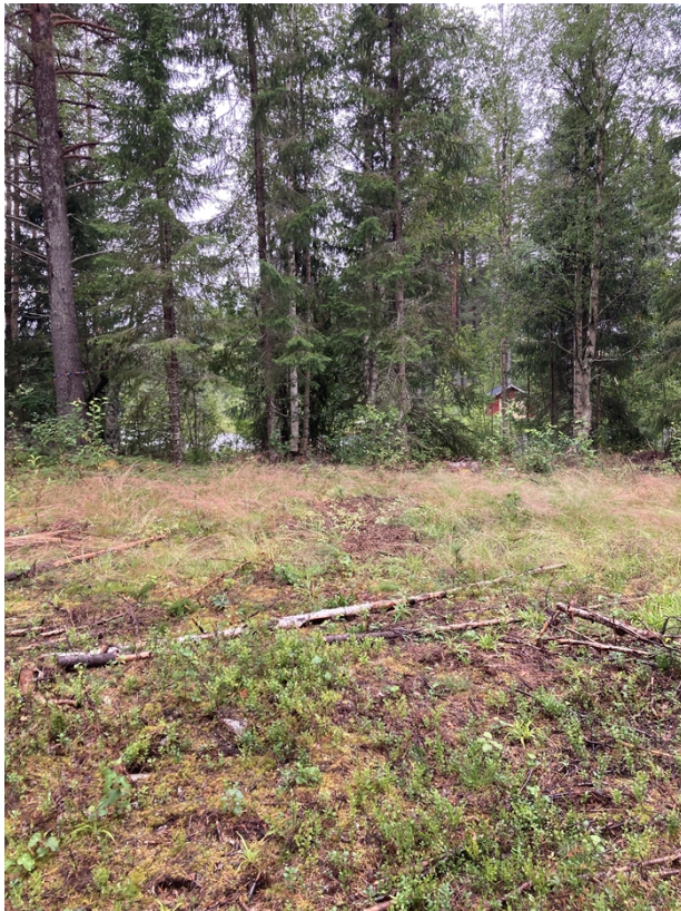
Figur 2, Vy från tänkt fritidsbus mot vattnet.