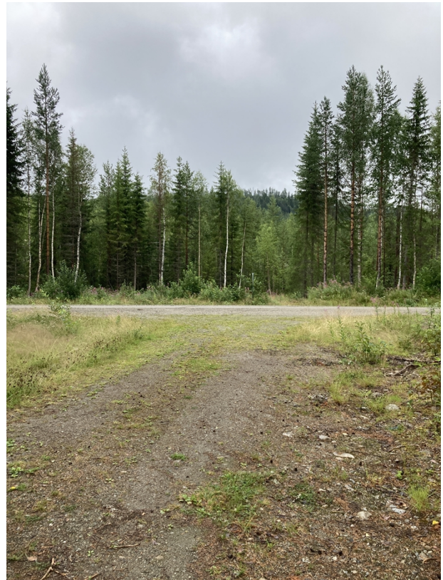
Figur 3, Befintlig infartsväg till platsen.