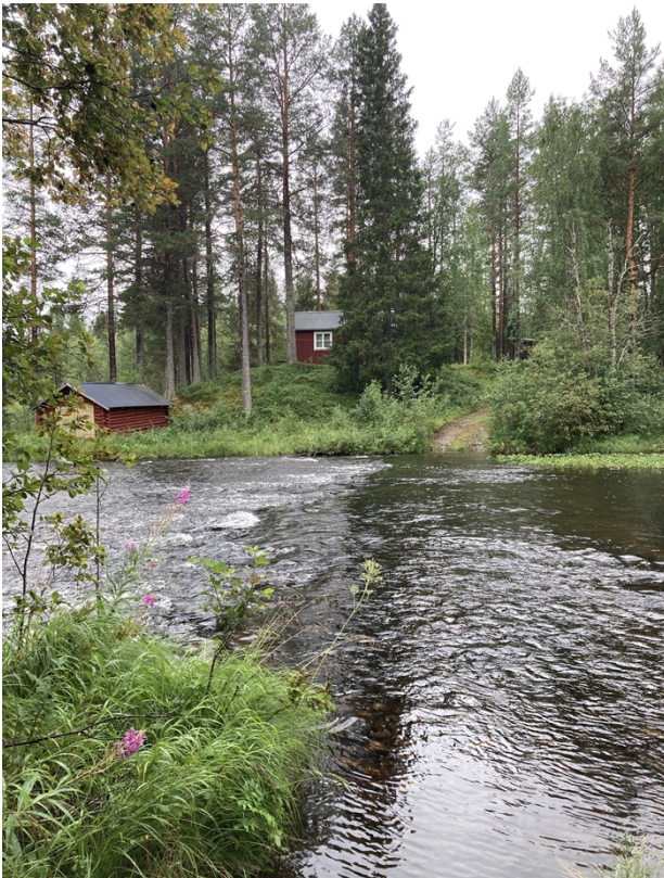
Figur 4, Befintligt fritidsbus och båthus på andra sidan vattnet.