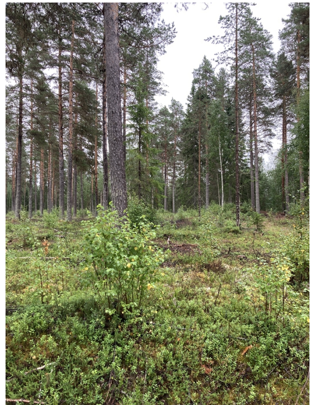
Figur 5, Plats för fritidsbus.